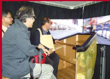
船鉦巡行振動体験