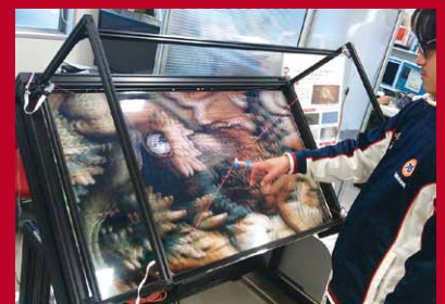
『立体的』織物の触覚体験