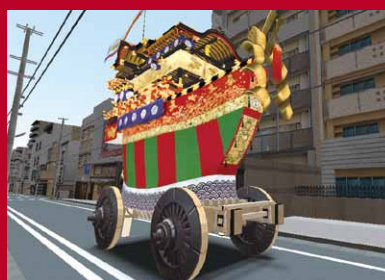
後祭・大船鉦を含んだバーチャル町並み復元