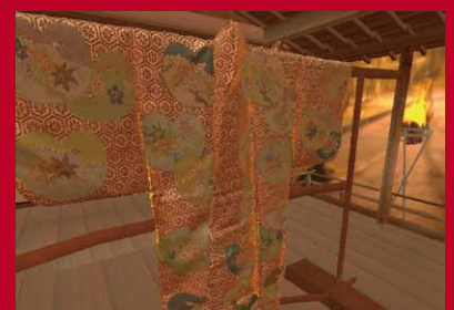
デジタル薪能の再現