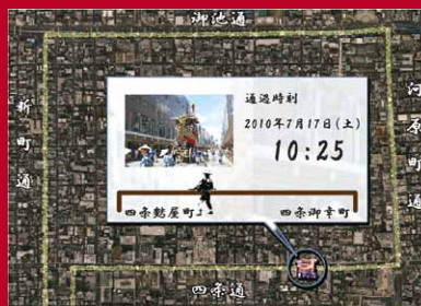
巡行経路運動型お囃子体験